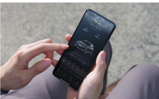
电动汽车专用服务