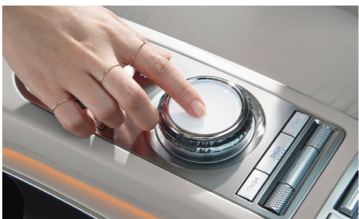
智能指尖交互系统