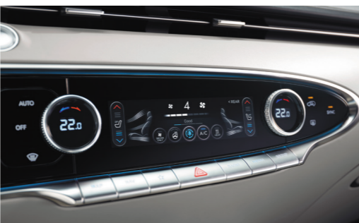
三区独立自动空调