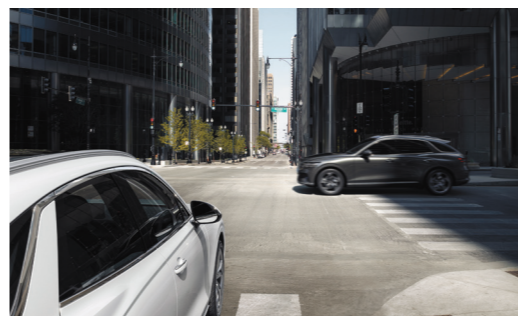
前方防止碰撞辅助