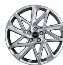
20英寸暗黑超银轮毂