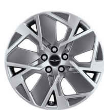
19英寸钻石切割轮毂