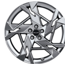
21英寸无限激光轮毂